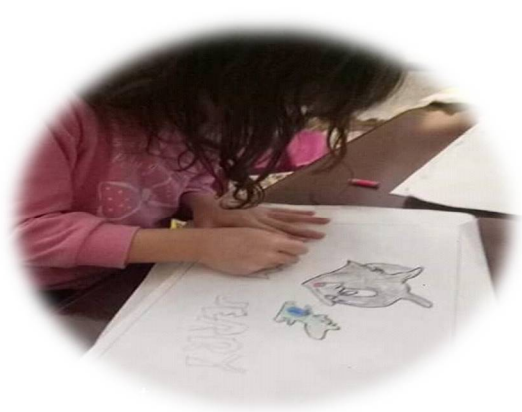
الصورة-10- أحد رسومات ورشة الرسم والتلوين