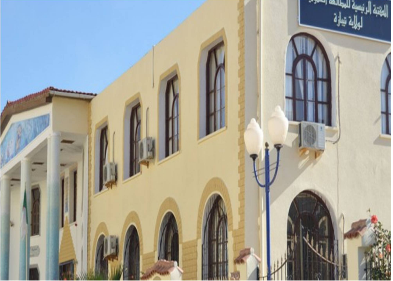
صورة للمكتبة الرئيسية للمطالعة العمومية – آسيا جبار- ولاية تيبازة