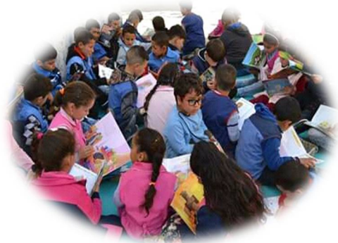
الصورة-7- ورشة القراءة داخل قسم الأطفال