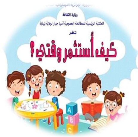
الصورة -14: مسابقة أستثمر وقتي

من خلال الصورتين 14، 15 يتبين لنا أن المكتبة تنظم العديد من المسابقات الثقافية والترفيهية للأطفال المنخرطين بها مثل مسابقة أستثمر وقتي، ومسابقة القراءة في احتفال. كما تنظم المكتبة ر.م.ع.أ.ج.و.ت للأطفال رحلات ترفيهية وزيارات ميدانية متنوعة ، وتستلزم هذه الرحلات والزيارات العديد من الوسائل أهمها التسريح الأبوي، مؤطرين، مبلغ التأمين، الأمن ، وسيلة النقل، أثاث الرحلة، مأكولات ومشروبات، وكانت وجهة بعض الرحلات التي قامت بها المكتبة إلى السدود والمزارع ، أو المتحف الموجود بولاية تيبازة أو إلى المدارس في المناسبات ،ومنه نرى أن هذه الوسائل كلها ضرورية للإستمتاع والشعور بالراحة أثناء الرحلة. وهذا ما توضحه الصور الآتية: