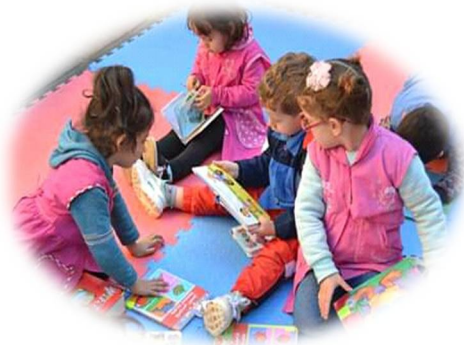
الصورة-8- ورشة القراءة في حديقة المكتبة