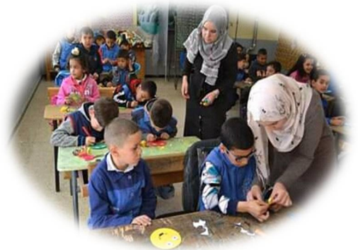
الصورة-12-ورشة الأشغال اليدوية