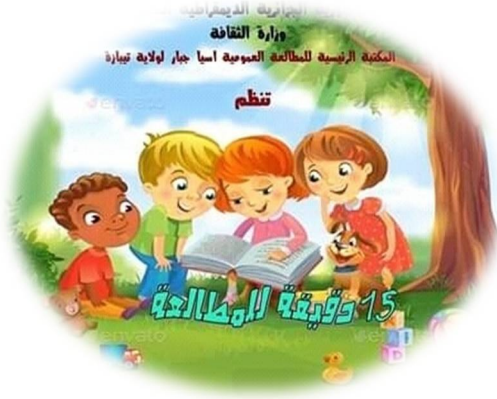
الصورة-15- : مسابقة القراءة في احتفال

ومن أهم المسابقات التي تنظمها المكتبة نذكر: