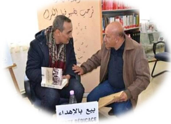
الصورة 5: - توضح البيع بالإهداء على مستوى المكتبة

نلاحظ من خلال الصورتين 5، 6 أن المكتبة تستعين بمصادر خارجية والمتمثلة في الكتاب والناشرين الذين يحضرون مؤلفاتهم إلى المكتبة من أجل تعريف الأطفال بها وبيعها بالإهداء أو بالتوقيع للمكتبة.