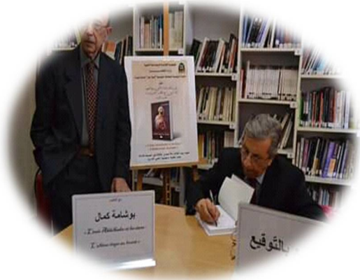
الصورة 6: توضح البيع بالتوقيع على مستوى المكتبة