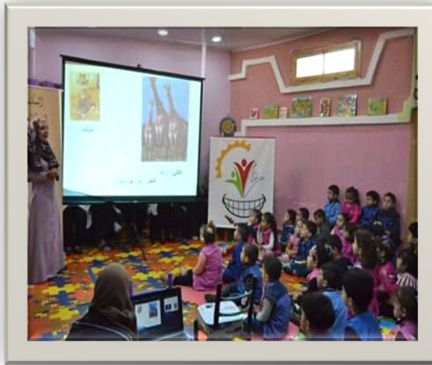
صورة-13- توضح رواية قصة على مستوى قسم الأطفال

نلاحظ من خلال الصورة رواية قصة للأطفال من طرف أحد الموظفين بقسم الأطفال بالمكتبة بواسطة جهاز الإسقاط.