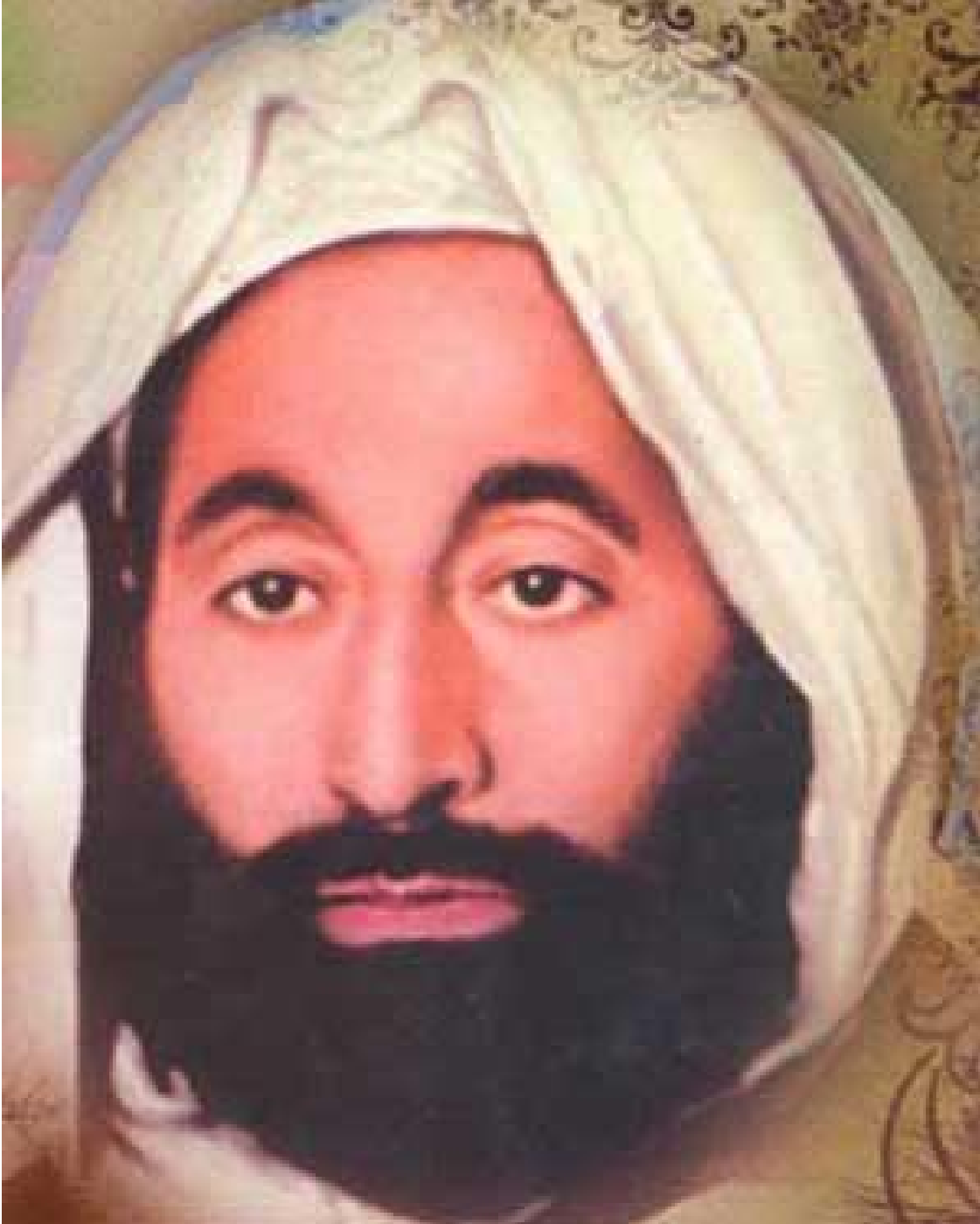
عبد الحميد بن باديس