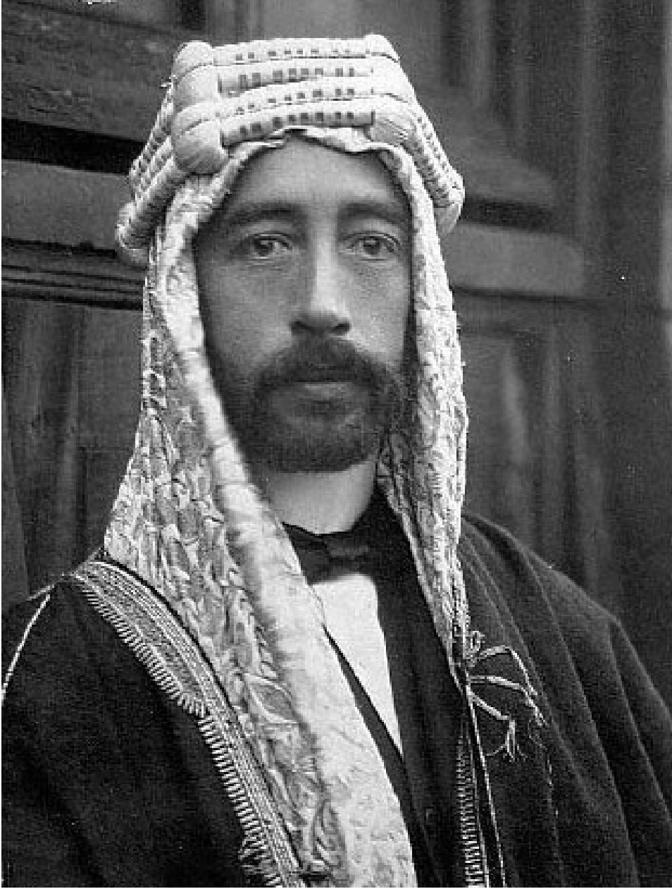
الملك فيصل الأول ملك العراق

الملحق رقم 05: فيصل ابن الشريف حسين ملك العراق. 1