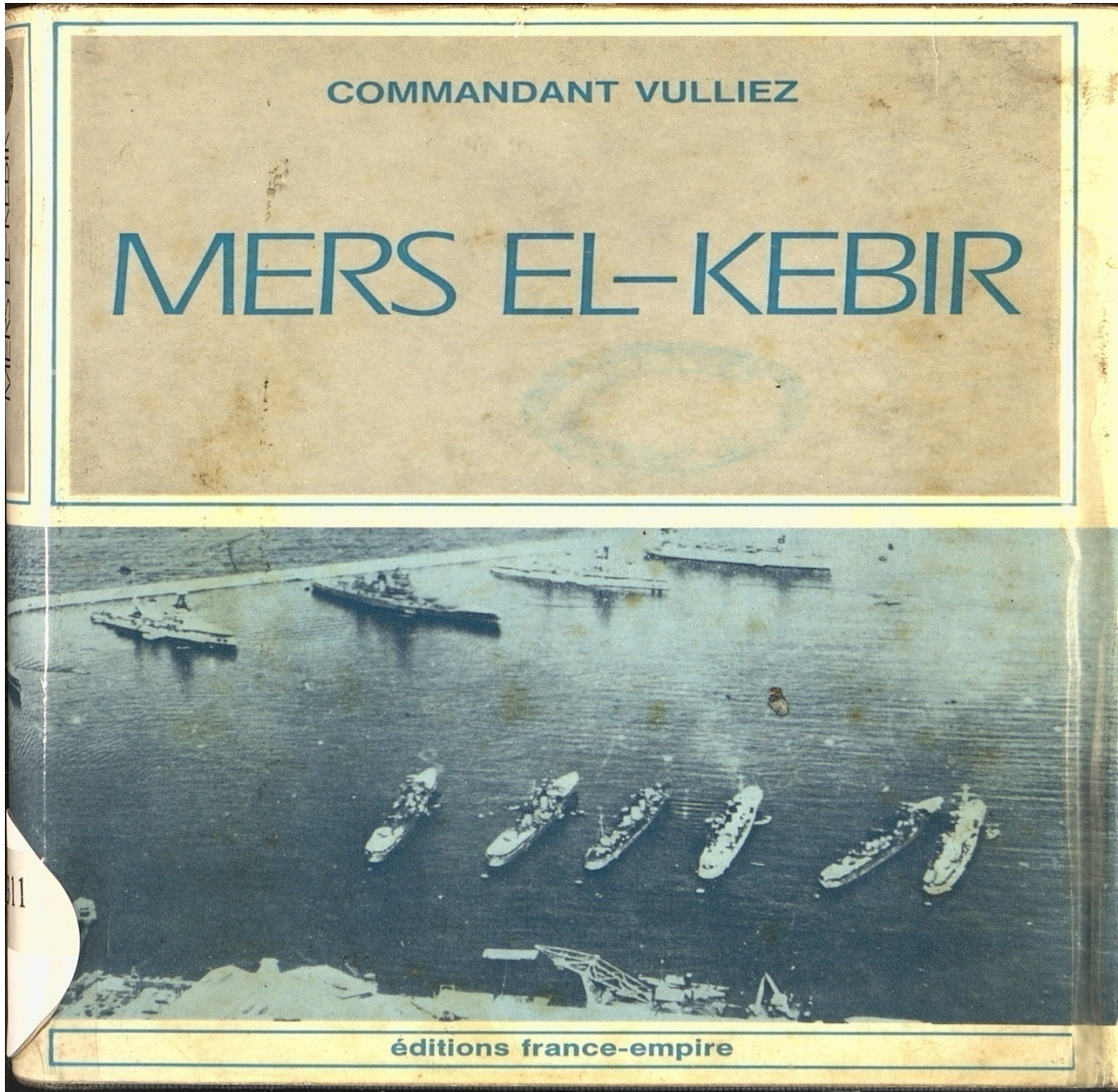
صورة رقم 03: نموذج عن كتاب نادر مرقمن