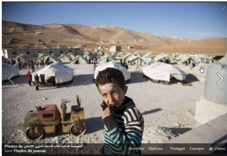
المفوضية السامية للأمم المتحدة لشؤون اللاجئين dans Photos du journal