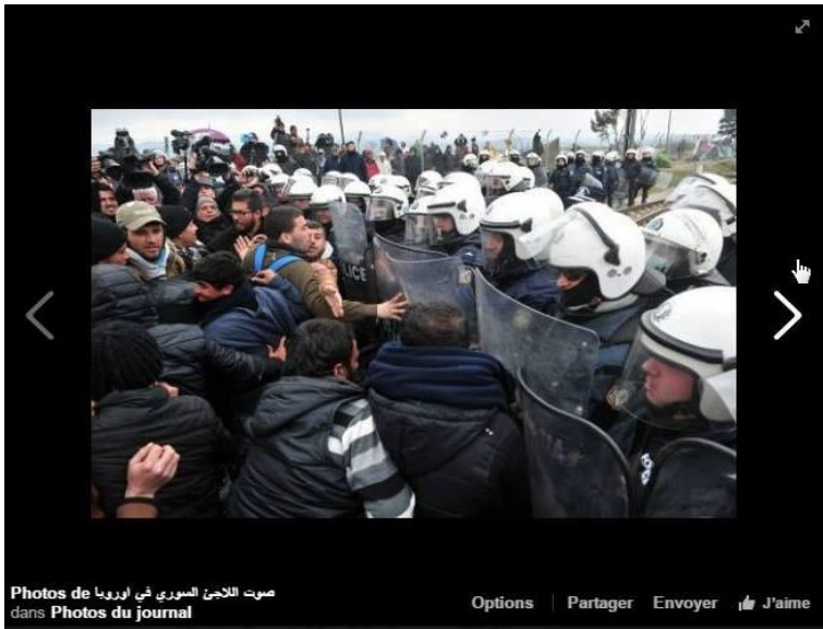
صوت اللاجئين السوري في اوربيا dans Photos du journal